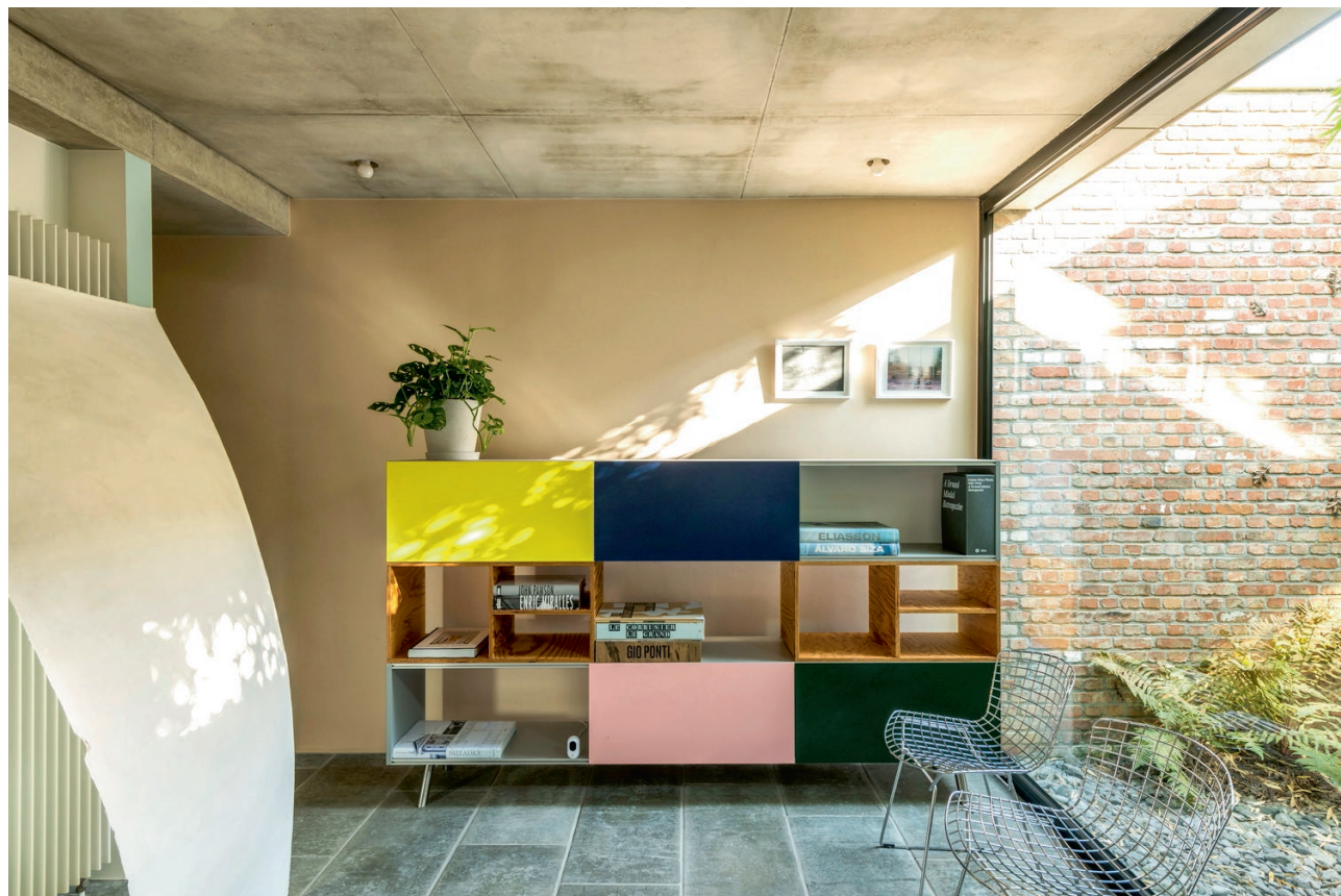
Op het gelijkvloers zorgen drie patio's voor lichtrijke rustpunten.

Een Sint-Niklase glazenier bouwde rond 1940 het eerste stuk van zijn magazijn. In de jaren 70 en 90 volgden nog twee delen. Toen Jao Smet als pas afgestudeerde architect vernam dat het pand van 4,5 meter breed en 68 meter lang al een hele tijd te koop stond, bood hij één vijfde van de vraagprijs. Hij had beet en vormde het magazijn om tot een rijwoning met architectenkantoor. Samen met zijn vader, een aannemer, zou hij het pand in fases verbouwen. Het volledige verbouwproces heeft maar liefst negen jaar in beslag genomen. “Ik had geen geld om alles in één keer af te werken. Elk weekend, elke feestdag en elke vakantie hebben mijn vader en ik verbouwd. Het vroeg doorzettingsvermogen, ja”, lacht Jao. “Ik wou geen compromissen. Deze woning moest exact worden wat ik voor ogen had. Mijn bureau kreeg voorrang. Daarna gaf ik mezelf alle tijd van de wereld.”